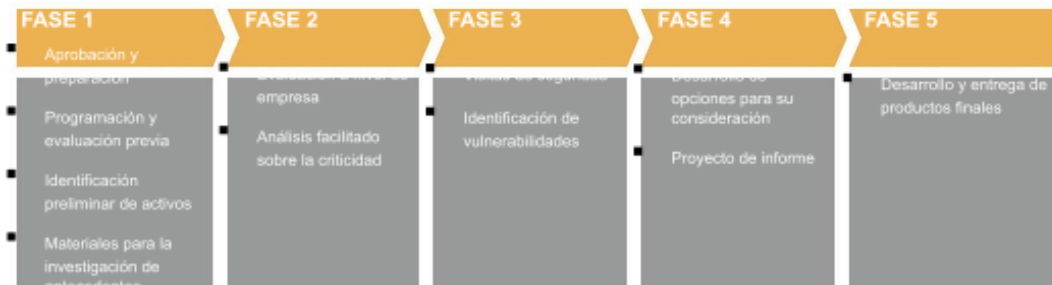
TABLA 1: FASES DE LA MASA

En la mayoría de los casos, se requiere el compromiso del siguiente personal de la empresa (o títulos similares):